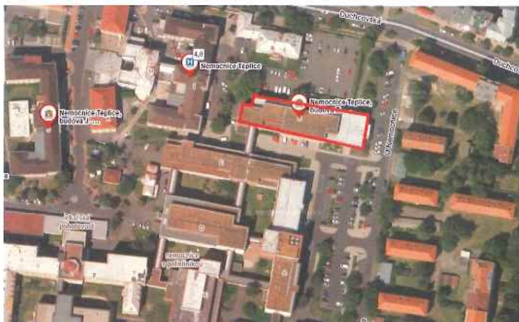
Obrázek 1 – Satelitní snímek posuzovaného objektu